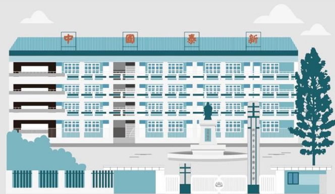
NEW TAIPEI MUNICIPAL XINTAI JUNIOR HIGH SCHOOL