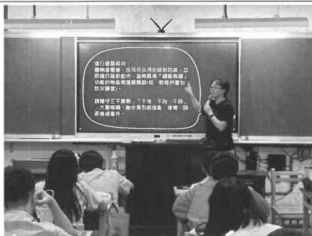
地點：各班教室 時間：113年8月30日-9月13日 說明：防災課程（童軍課）