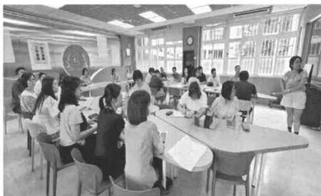
地點：校史室 時間：113年09月 說明：