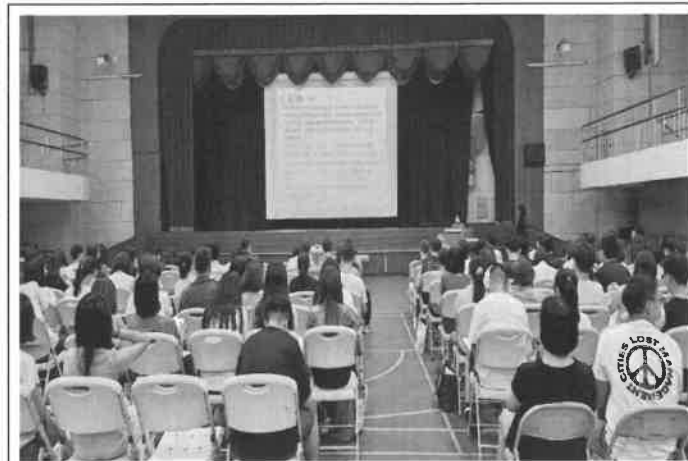
地點：活動中心 時間：113年08月29日 說明：校務會議防災宣導