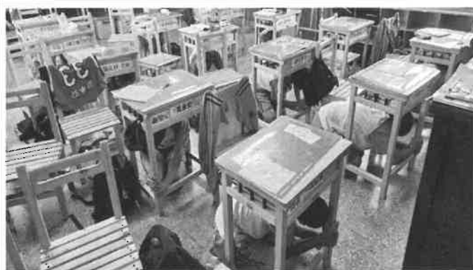
地點：各班教室、操場 時間：113年09月18日 說明：防災第二次預演