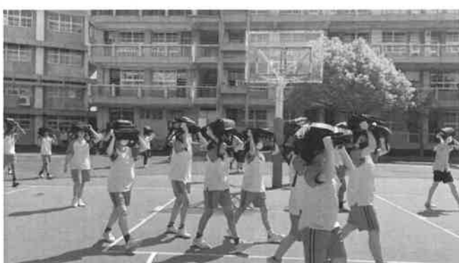
地點：學校操場 時間：113年09月20日 說明：正式防災演練