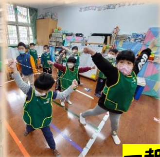
一起來跳線線體操