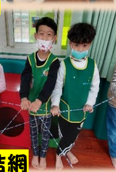
化身蜘蛛吐絲結網