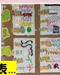
我們一起分工合作完成了大圖表...