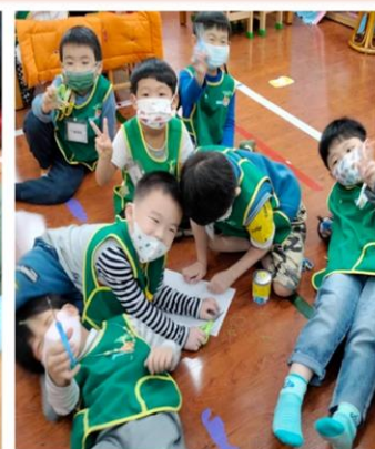
這裡有牙齒線、波浪線、生命線...

在線線體能活動後，我們將方向轉移到「線條的形狀」，透過孩子的視角去認識線條，可以得到很多豐富且有趣的想法，並且更加容易記住。